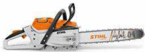
MOTORSÄGE MSA 300 C-O 36 V • 3,0 kW ① • 4,5 ② / 5,4 kg ③

MSA 200 C-B ohne Akku und Ladegerät ④ Schielenlänge 30 cm Bestellnummer MA03 200 0009 CHF 510.-