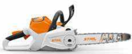
MOTORSÄGE MSA 200 C-B 36 V • 1,8 kW ① • 3,1 ② / 3,5 kg ③

* Aktion gültig mit dem Akku AP 200 S und AP 300 S. Andere Akkus sind von der Aktion ausgeschlossen.