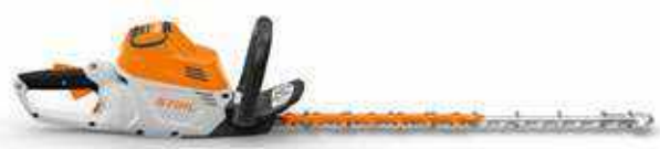
HECKENSCHERE HSA 100 36 V • 3,7 kg ③

MSA 300 C-O ohne Akku und Ladegerät ④ Schielenlänge 45 cm Bestellnummer MA02 200 0025 STATT CHF 1005.-