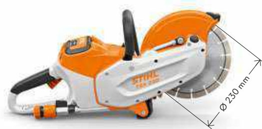
TRENSCHLEIFER TSA 230 ③ 36 V • 3,9 kg ③